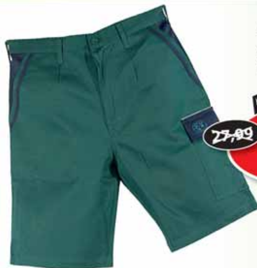
Berufsshorts Tom verschiedene Farben und Größen