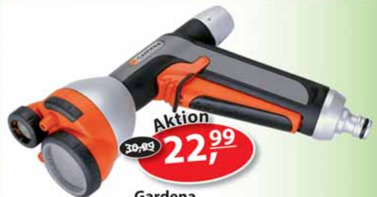
Gardena Giessbrause Premium 4in1