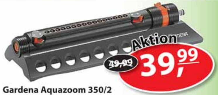
Gardena Aquazoom 350/2

für Flächen von 28 - 350 m 2 , Reichweite verstellbar von 7 m bis max. 21 m, Sprengbreite verstellbar von 4 m bis max. 17 m