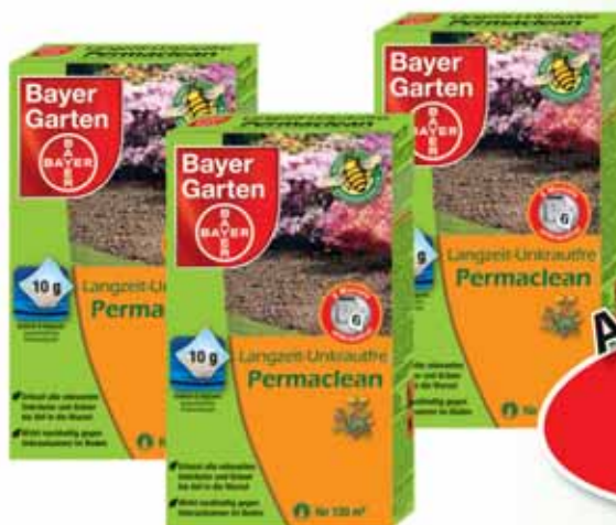
Bayer Langzeit Unkrautfrei Permaclean

6 Monate unkrautfrei, verschiedene Größen