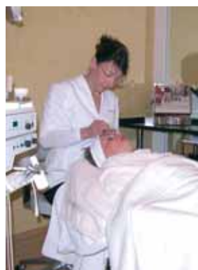
Behandlung im Kosmetikinstitut

beiter der Parfümerien und Kosmetik-institute selbstverständlich. Anregungen der Kunden werden dankbar und gerne angenommen.