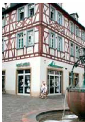
Filiale in Alzey in zentraler Lage

Produkten, die mit Begeisterung empfohlen werden können. Ständig wird sich